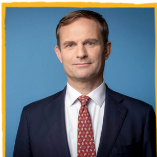
Teun Struyken, Staatssecretaris Rechtsbescherming